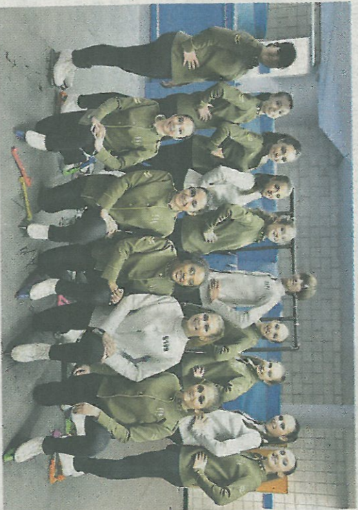
Le formazioni delle Snowflakes

Ifocchi di neve sono candidi e impalpabili. Cadono silenziosi nelle fredde serate d'inverno; pur e leggerissimi ammantano di bianco le case, i prati e gli alberi. Sono un'immagine di perfezione come quella evocata da una danzatrice sul ghiaccio; la stessa a cui si ispirano gli atleti del PAT, che proprio pensando alla traduzione inglese di "focchi di neve" hanno deciso di chiamare Snowflakes la loro squadra di theatre